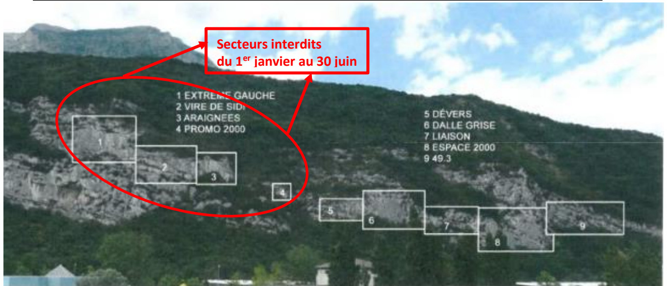
Rochers de Comboire (Seyssins)