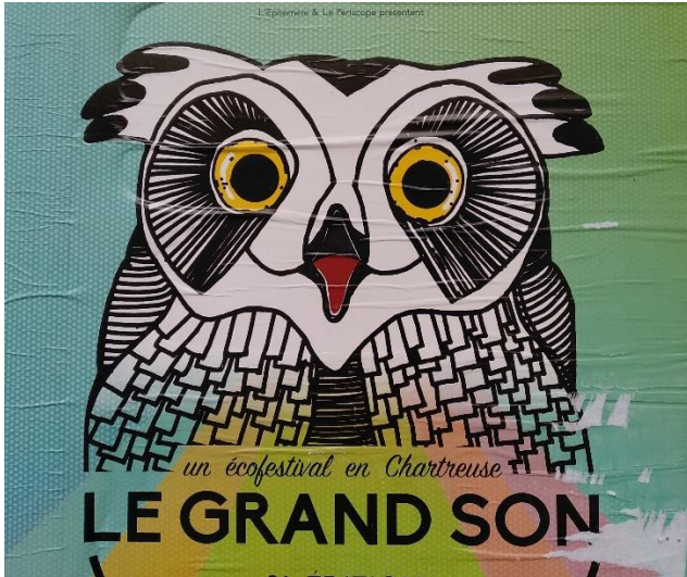
Extrait de l'affiche de l'écofestival en Chartreuse Le Grand Son de 2018

Ce 10 ème bilan du suivi Grand-duc d'Europe ( Bubo bubo ) en Isère recense les nombreuses données saisies sur le site web Faune-Isère qui va laisser sa place à Faune Aura. D'autres me sont confiées directement par des naturalistes indépendants (période allant du 01/10/2021 au 30/09/2022). Transmis au réseau national - LPO conservation rapaces – ce bilan étoffe la connaissance de ce grand rapace nocturne sur le plan national, encourage et motive l'ensemble des membres du réseau qui dédient leur temps à la surveillance et la protection de l'espèce.