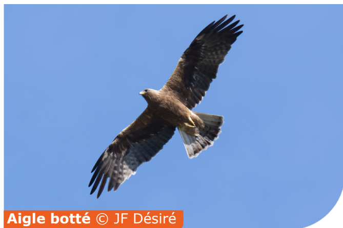
Aigle botté