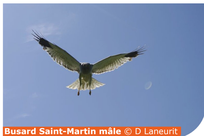
Busard Saint-Martin mâle