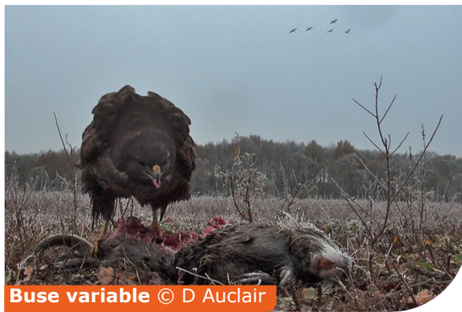
Buse variable