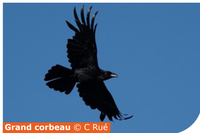
Grand corbeau